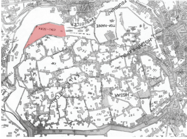
Ek 2: 1880 tarihli haritada “Eski-Sera” olarak gösterilen Yeni Saray Bölgesi (Osmangazi Belediyesi Arşivi’nden Saadet Maydaer, Osmanlı Klasik Döneminde Bursa’da Bir Sente Hisar , Emin Yayınları, Bursa 2009, s. 309).