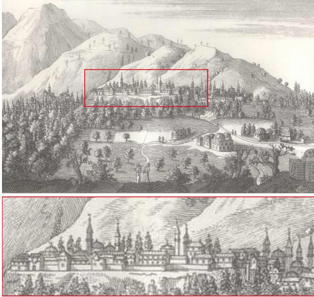
Ek 3: 1701 tarihinde Bursa’yı ziyaret eden Tournefort’un gravüründe Hisar Bölgesi kuzey yamacında yapılaşma ( Gravürlerle Türkiye Anadolu 1 , yay. Mustafa Sevim, T.C. Kültür Bakanlığı, Ankara 2002).