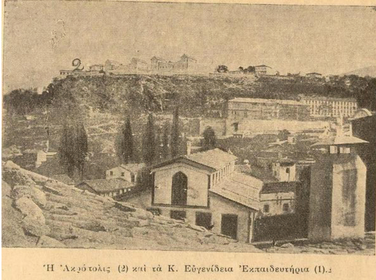
Ek 6: Hisar yamacında (2 numara ile) Ahmed Vefik Paşa Hastanesi'ni gösteren tarihsiz fotoğraf