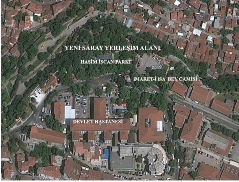
Ek 5: Yeni Saray Yerleşim alanını gösteren uydu fotoğrafı