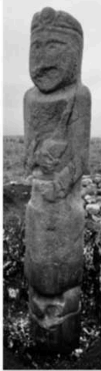
Mongolküre yazıtı (soldaki resim de la Vaissière 2011, sağdaki Osawa 2006'dan alınmıştır)