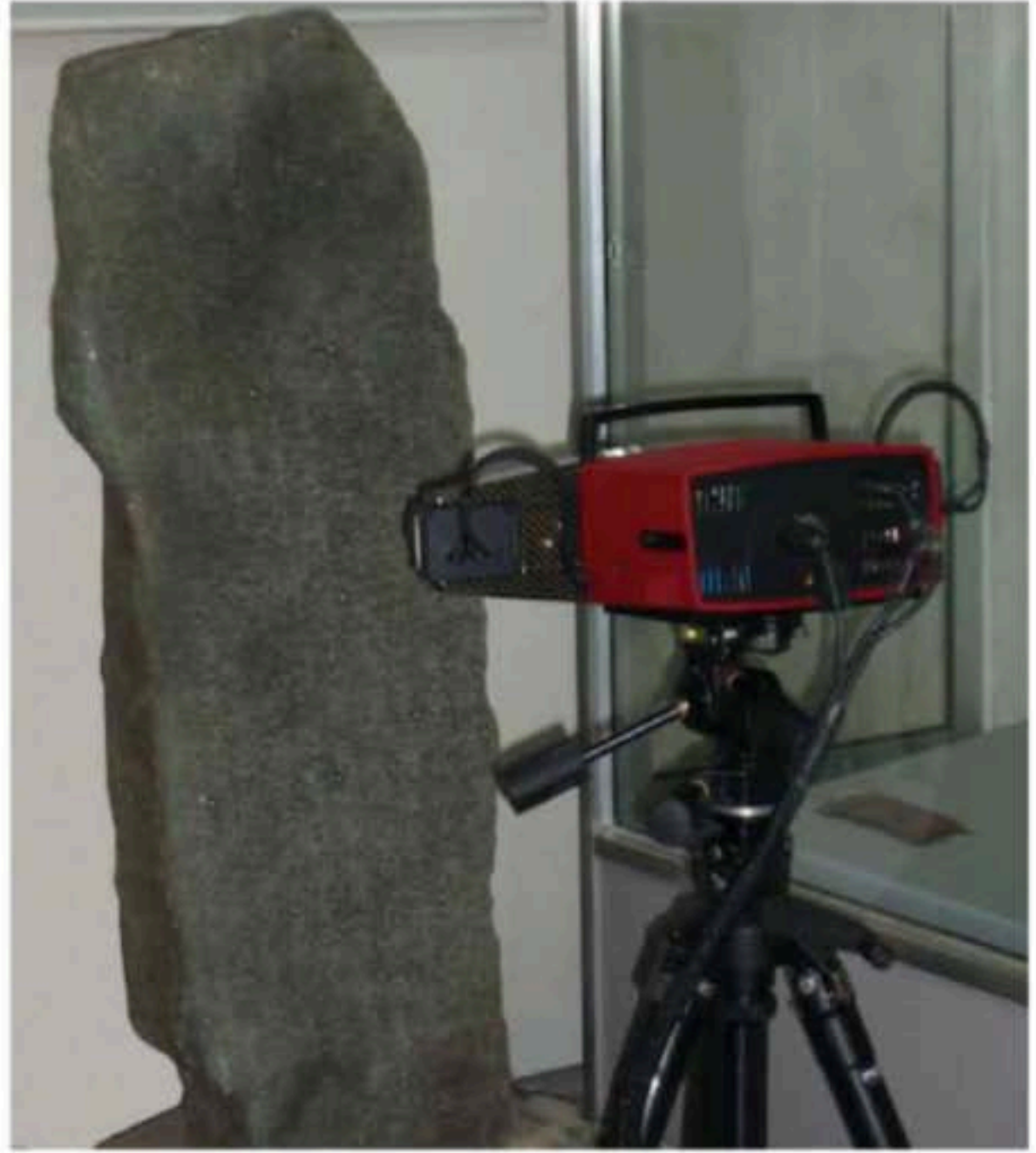
Hüys Tolgoy (I) yazıtının 3D teknolojisi ile kayda alınması