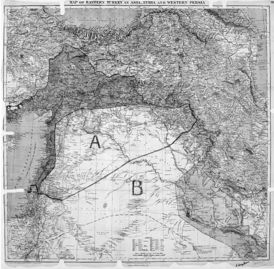
Resim 3: Sykes-Picot Antlaşmasına Temel Oluşturan Harita: Asya, Suriye ve Batı İran'da Doğu Türkiye'nin Haritası 4