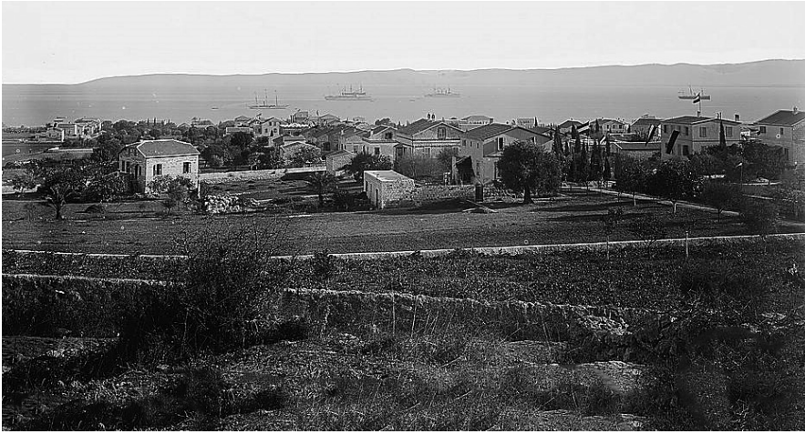
Resim 4: Hayfa'daki Alman Kolonisinin Bir Görünümü. 24

Avrupa'nın büyük gemicilik ve sigorta şirketlerinin Hayfa'daki temsilcileri konumuna geldiler. 23 İngiltere'nin Hayfa'da daimi bir konsolosu bulunuyordu ve bölgede Almanya lehine olarak meydana gelen tüm gelişmelerden şüphesiz hızla ve ayrıntılarıyla haberdar oluyordu. İngiltere'nin Sykes-Picot'ta Hayfa ve Akka'yı alması bölgedeki gittikçe artan ve büyüyen Alman etkisine son vermeyi amaçlayan projenin ilk adımıydı. İkincisi Eylül 1918'de İngiltere'nin Hayfa ve Akka'yı işgaliyle ve İngiliz mandasını burada kurmasıyla gerçekleşecektir.