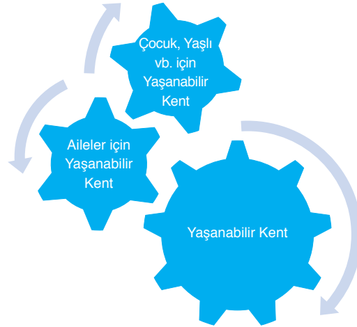
Şekil 1: Aileler için Yaşanabilir Kentler Bağlamında Bir Çerçeve Önerisi

değiştirse ve farklılaşsa bile) ailenin bulunmadığı bir toplum tahayyülü imkânsızdır. Çünkü aile, neslin devamının sağlanması için en temel güvence ve toplumsal ilişkilerde merkezî önemi haiz kurumların başındadır. Aile tanımlarında farklılıklar ve aile karşısında alınan farklı pozisyonlar bulunmaktadır. Aile dostu kente giden yolda, kavramın değil ilkelerin kullanılması her iki yaklaşımın ortaklaştığı en önemli hususlardan biridir.