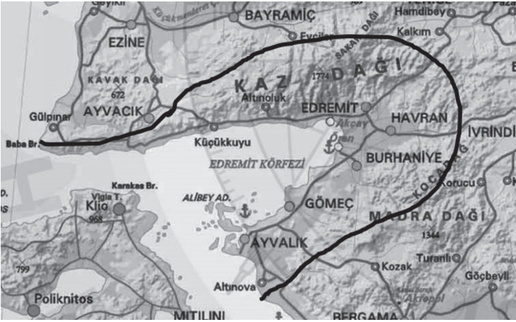
Şekil 1.Edremit Yöresi Sınırları

Yörelere konumlarının sağladığı avantajlara sahiptir. Bunların değerlendirilmesi de rekabet gücünü artıran en önemli etkidir. Edremit Yöresinde Akdeniz ikliminin sağladığı en önemli avantaj tarımsal çeşitlilik sağlamasıdır bu olanakla Ege Bölgesinin iç yöreleriyle rekabet edebilir. İç yörelerle rekabet edebilmesini sağlayan bir diğer etken deniz turizmi, deniz ticareti, balıkçılık, liman işletmeciliği vb. denize ve kıyıya bağlı faaliyetlere olanak vermesi açısından Edremit Körfezi'yle kıyısı olmasıdır. Yörenin İstanbul ve İzmir gibi iki önemli merkeze yakınlığı bölge içinde ve bölgeler arası rekabette bir avantaj sağlamaktadır.