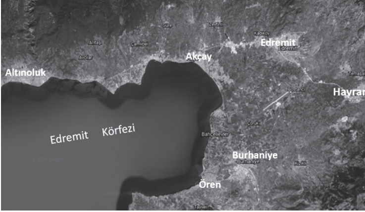
Şekil 2.Edremit, Havran ve Burhaniye’nin Konumu

Edremit kıyından içeride kurulmuş olmakla beraber kıyıda büyük bir mahalle olarak Akçay yer alır(şekil 2) Kıyı çoğunlukla yazlık konutlarla kaplanarak yerleşmeye açılırken kıyından içeride olan Edremit tarihsel yapısını korumuştur ve kültürel kaynaklarını ön plana çıkararak turizmden pay almaya çalışmaktadır. Edremit’in tarihsel bir zenginliği Selçuklu Dönemi tarihine sahip olmasıdır. 1231 yılında Edremit’i fetheden Selçuklu komutanı Yusuf Sinan tarafından Kurşunlu Cami yaptırılmıştır. Edremit’te Hacı Kabakçı Evi, Evliya Zade İhsan Bey Evi, Hacı İsmail Seyvan Evi gibi tarihi evler korunmaya alınmıştır.