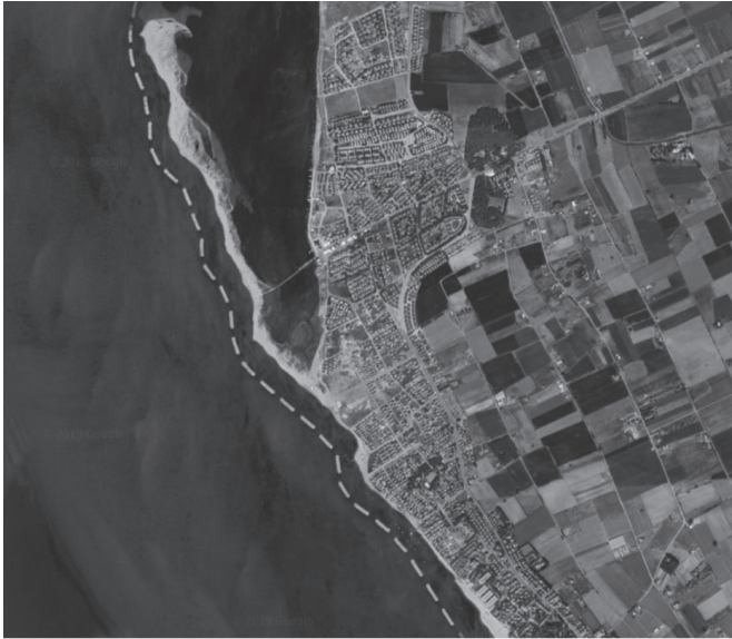
Şekil 3. Altınova Kıyı Oku ve Dalgakıranlar

Doğa ve insan arasındaki ilişkiler yörelerin rekabet gücünü azaltmakta veya artırmaktadır. Doğanın kültür üzerinde antik dönemlerde olumsuz etkisi olmuştur. Doğanın kültüre ilk etkisi Madra çayının kıyıyı 2-3 km. ilerletmesi 8-10 m. kadar alüvyon biriktirerek kültür kalıntılarını alüvyon altında bırakmasıdır (Kayan,2003). Günümüzden 7000 yıl önce deniz Yeni Yeldeğirmeni Tepe Höyüğü doğusuna kadar 2,5-3 km. kadar sokulmuştur (Vardar&Öner,2007). Burada doğa-insan ilişkisinde bu sefer insan doğayı etkilemiştir. 1998 yılında tamamlanan Madra Barajı kıyıya tortu taşınmasını azaltmış denizin aşındırma gücü ön plana çıkmış ve kıyı erozyonu gelişmiştir (Soykan,1997;Vardar&Öner,2017).