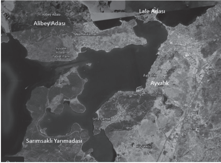
Şekil 4. Ayvalık Limanı

Yörenin rüzgâr enerji santralleri için uygun rüzgâr hızlarına sahip olması yer seçimi konusunda sorun çıkartmaktadır. Cunda Adasına yapılmak istenen RES için çok büyük tepkiler olmuştur. Cunda Adası farklı ekosistemleri içeren Tabiat Parkıdır ve doğal sit alanıdır. Yapılacak rüzgâr tribünleri doğal peyzaja girerek manzarayı bozacak, yapılacak alanda orman tahrip edilecektir. İtirazlar sonucu santralin yerinin Burhaniye tarafında olmasına karar verilmiştir.