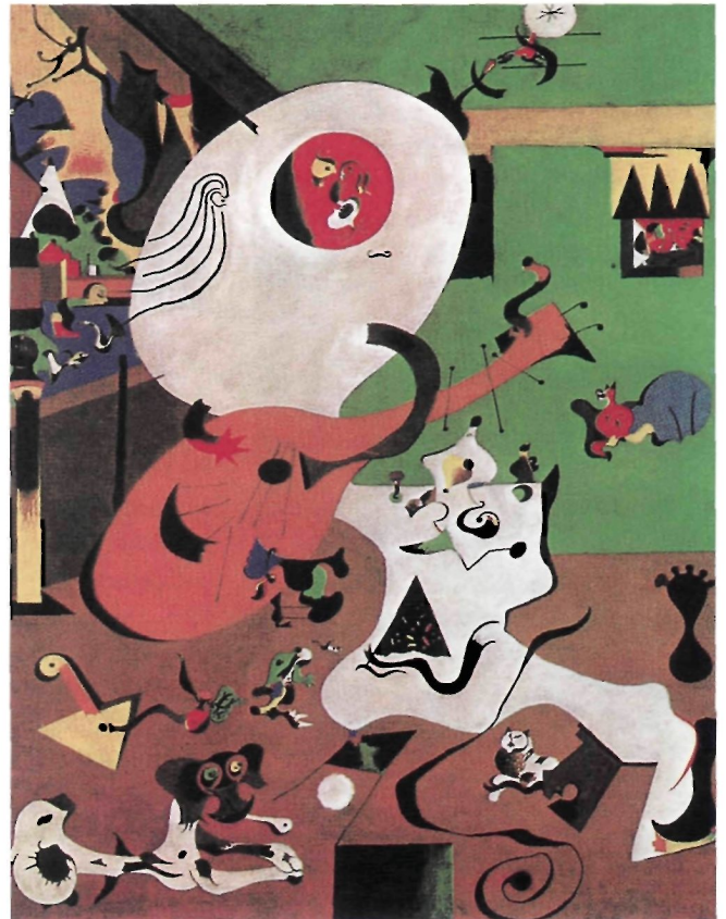
JOAN MIRO, 1928