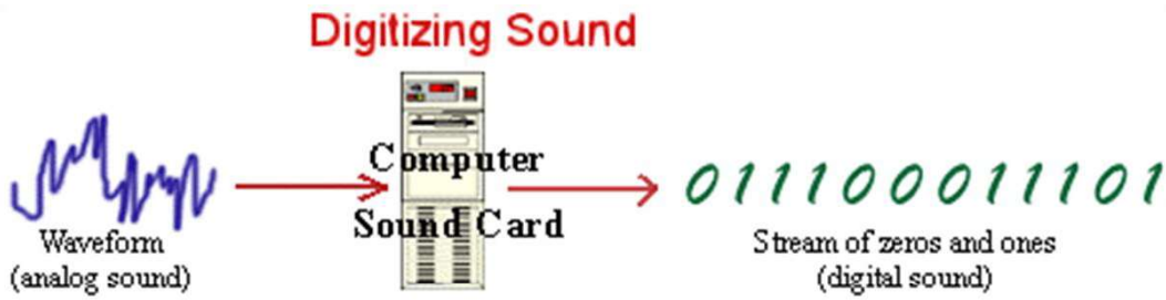
Şekil 2. Sesin analogtan dijital dönüşümü (Ya-Ping Hsieh, 2015: 2)

Özellikle dijitalleştirme işlemleri için çok sayıda teknik elemana gereksinim duyulmuş ve uzun zamanlar gerektiren meşakkatli bir dönüştürme süreci başlamıştır.