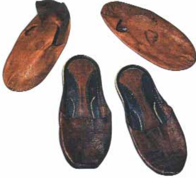
Aziz Mahmud Hüdâyî ait Edik ve Çedik

viyyetin “he”sine ve devr-i vücûda delâlet eder. Vedûd isminde ebrâr ve mukarabînin makâmına işâret vardır. Eğer “vâdd” kelimesi, ism-i fâil olarak düşünülürse seven ve âşık anlamına; ism-i mef’ûl olarak kabul edilirse sevilen ve ma’şûk mânâsına gelir. 99