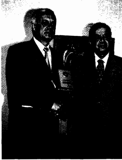
Erol Akıncılar, Şehir ve Başkan dergisi tarafından yılın "En Başarılı Büyükşehir Başkanı" seçilen İzmir Büyükşehir Belediye Başkanı Ahmet Piriştina'ya plaketini verirken

te sahipleri çıkarırdı. Gazete sahipleri çıkardığı için de mesleğin, çalışanın sorunlarını bilen insanlardı. Mesleklerinin dışında bir işleri yoktu ki. Gazete sahibi gazeteciydi ve öyle itibar görüyorlardı. Bizim dönemimiz, bizden önceki dönem, hatta bizden sonraki bir dönem hiçbir gazete sahibinin gazetecilik dışında iş yaptığını biz görmedik, şahit olmadık. Böyle olduğu için de meslek ayrı bir itibar içindeydi. Bugün geldiğimiz nokta nedir? Sorarım ben size, hangi gazetenin sahibi gazeteci? Gazete sahiplerinin bir değil, birkaç işi var. Bazıları bunu bir araç olarak kullanıyor. Maalesef bu, olmaması gereken bir durum. Bu saha kârlı bir saha mı? Kimine göre kârlı, kimine göre değil. Ama ben değişik işler yapıyorsam bu sektörün kârlı olması benim için hiç önemli değil. Ben gazeteden kazansam da olur kazanmasam da olur. Bir gazete, televizyon sahibi olarak ben bir güç sahibiyim. Güç sahibi oluyorum, öyle